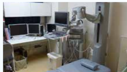
3D乳房X线照相机(日本仅有5台)