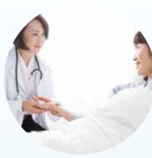
高尚的医德，温馨的医疗服务，无微不至